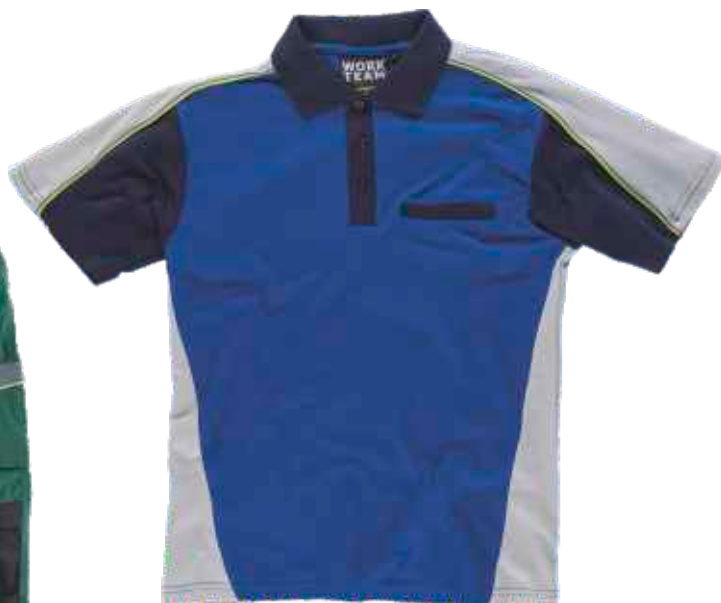
gris osc./gris cl./negro verde osc./gris osc./negro