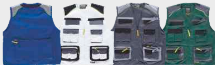
azulina/gris cl./marino blanco/negro/gris osc. gris osc./gris cl./negro verde osc./gris osc./negro