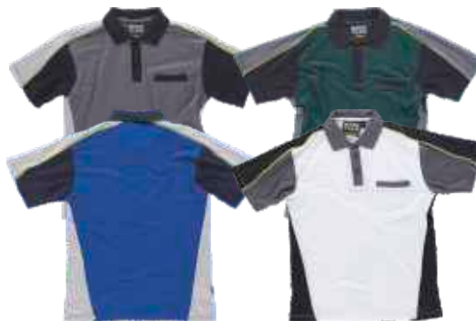
azulina/gris cl.o/marino blanco/negro/gris osc.