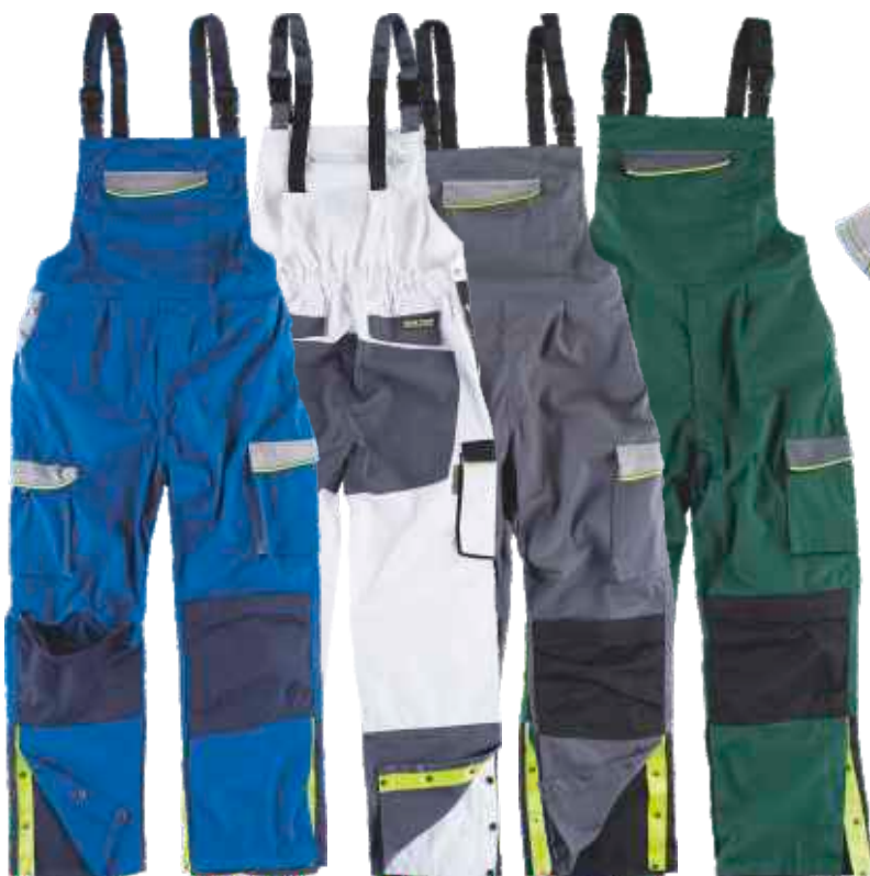
azulina/gris cl.o/marino blanco/negro/gris osc. gris osc./gris cl./negro verde osc./gris osc./negro

Tejido: 65% Poliéster 35% Algodón (230 g/m2)